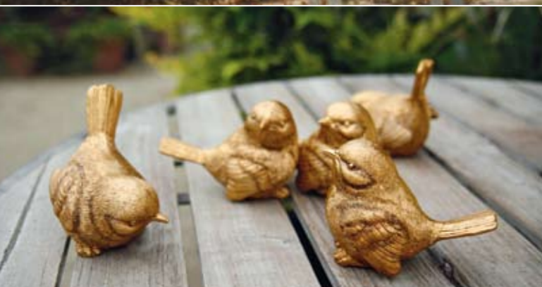
Tylko małe wróble, stali bywalcy ogrodu, nie czują powagi sytuacji.